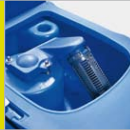
Nem adgang til rengøring af snavsvandstank

Denne nye SCRUBTEC-serie af walk-behind gulvvaskemaskiner repræsenterer en moderne og praktisk tilgang til effektiv gulvrengøring. I kraft af sin politik om løbende dialog med kunderne er Nilfisk-ALTO i stand til at udvikle maskiner med de funktioner, som brugerne rent faktisk efterspørger. Hverken mere eller mindre.