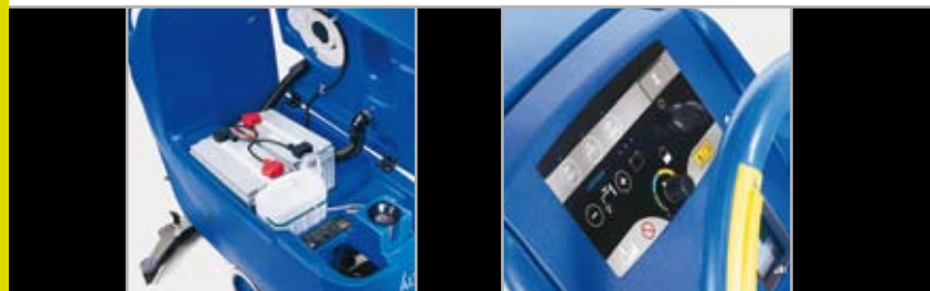
System til blanding af rengøringsmidler som ekstraudstyr