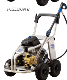
POSEIDON 8 ST