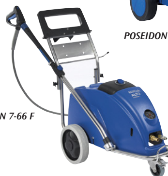
POSEIDON 7-66 F