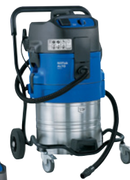
ATTIX 761-21 XC