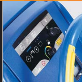
Ergonomisk greb og brugervenligt betjeningspanel